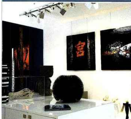
L'art sous toutes ses formes à la LM Galerie.

les sélections du mois / this month's selections