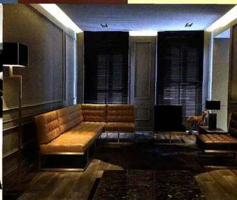
L'univers Trussardi s'invite chez vous.